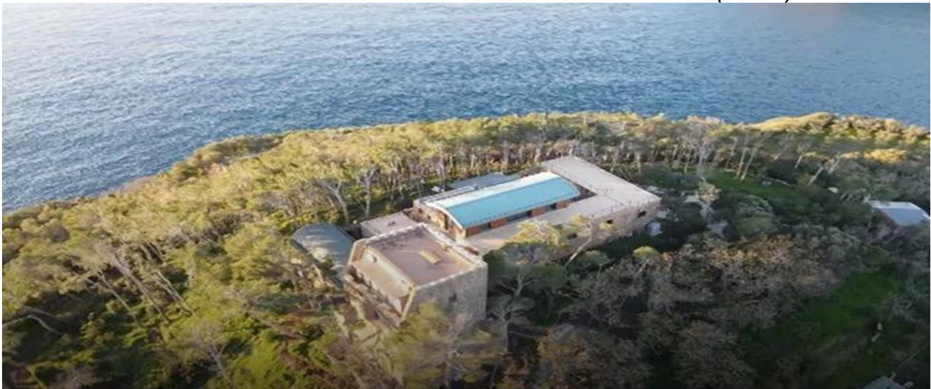
CENTRO SAMA – ANTICO MONASTERO BENEDETTINO - La Chiaiolella – Procida